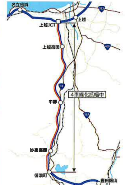
4車線化事業位置図