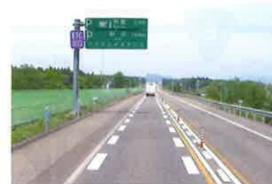
(供用車線の案内標識の移設)