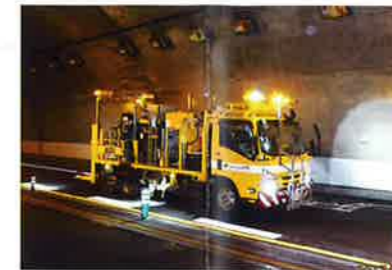
(供用車線の路面標示施工)