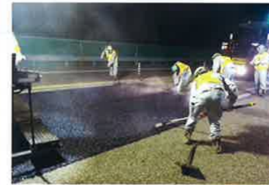
(供用車線の舗装補修)

上信越自動車道 信濃町IC~中郷IC間は平成9年10月に、中郷IC~上越JCT間は平成11年10月に 暫定2車線運用で開通しました。その後、平成24年4月の事業許可変更を受け、信濃町IC~上越JCT の4車線化事業を開始していますが、今回工事が進捗し、完成4車線化に向けた準備工事として供用 車線の舗装工事や設備移設・更新工事を通行止めにより実施します。