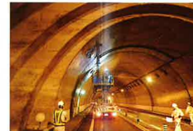
(供用車線のトンネル照明設備更新)