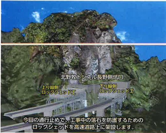
北野牧トンネル長野側坑口