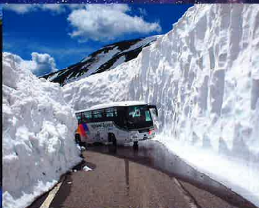
春山バス（圧巻！雪の回廊） 4月末～6月末日