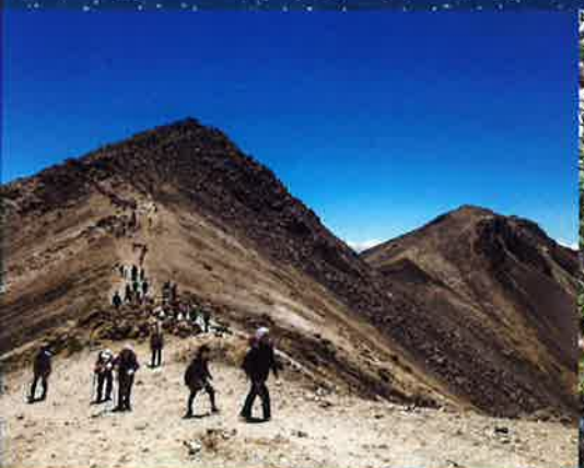
乗鞍岳登山と高山植物 3026m 7月上旬～