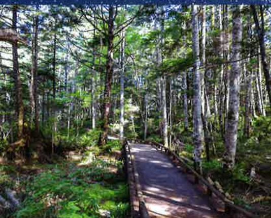
高原内 原生林ウォーキング、滝巡り 4月～11月