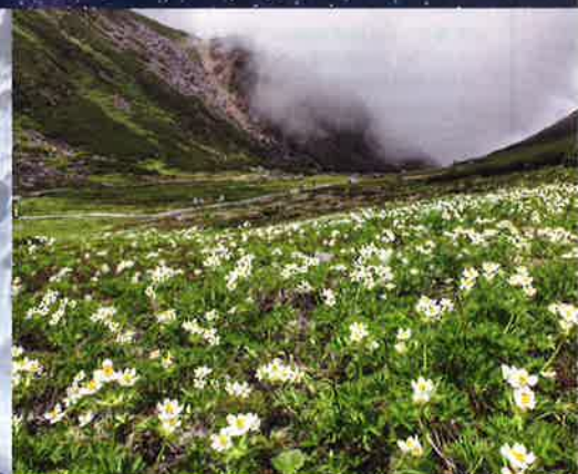
標高2700mの畳平 高山植物 見頃 7月中旬～8月中旬