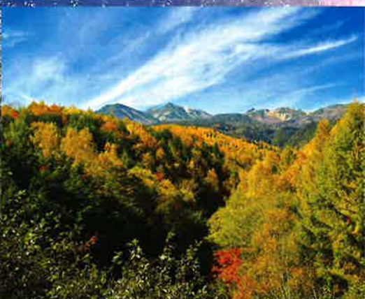
乗鞍岳、乗鞍高原の紅葉 9月中旬～10月中旬