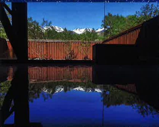
4種類の温泉が楽しめる！ 乗鞍高原温泉郷