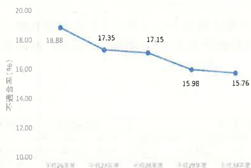
不適合率の推移 (最近5年間)