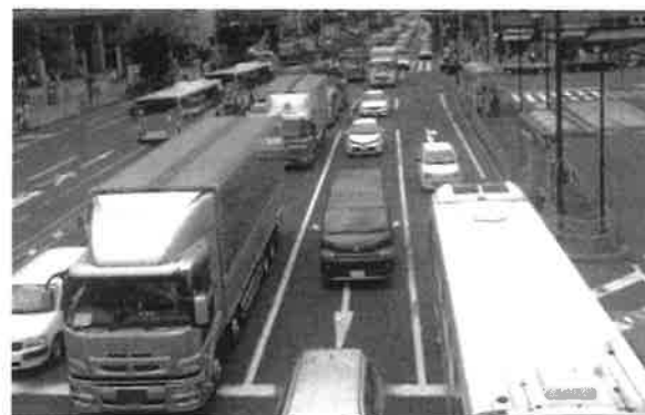
<トラックが渋滞に巻き込まれている状況>