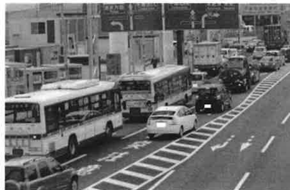
<バスが渋滞に巻き込まれている状況>