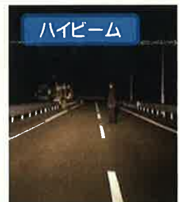
夜間、ドライバーから見た右から横断歩行者