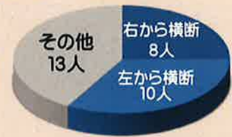
ドライバーから見た行動別グラフ