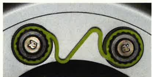
左右のホイール・ナットが緩んだ状態