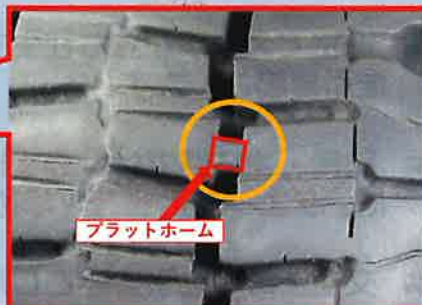
残り溝深さが「プラットホーム」に達している状態。冬用タイヤとして使用できません。