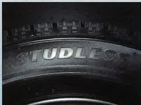
スタッドレス表記の例